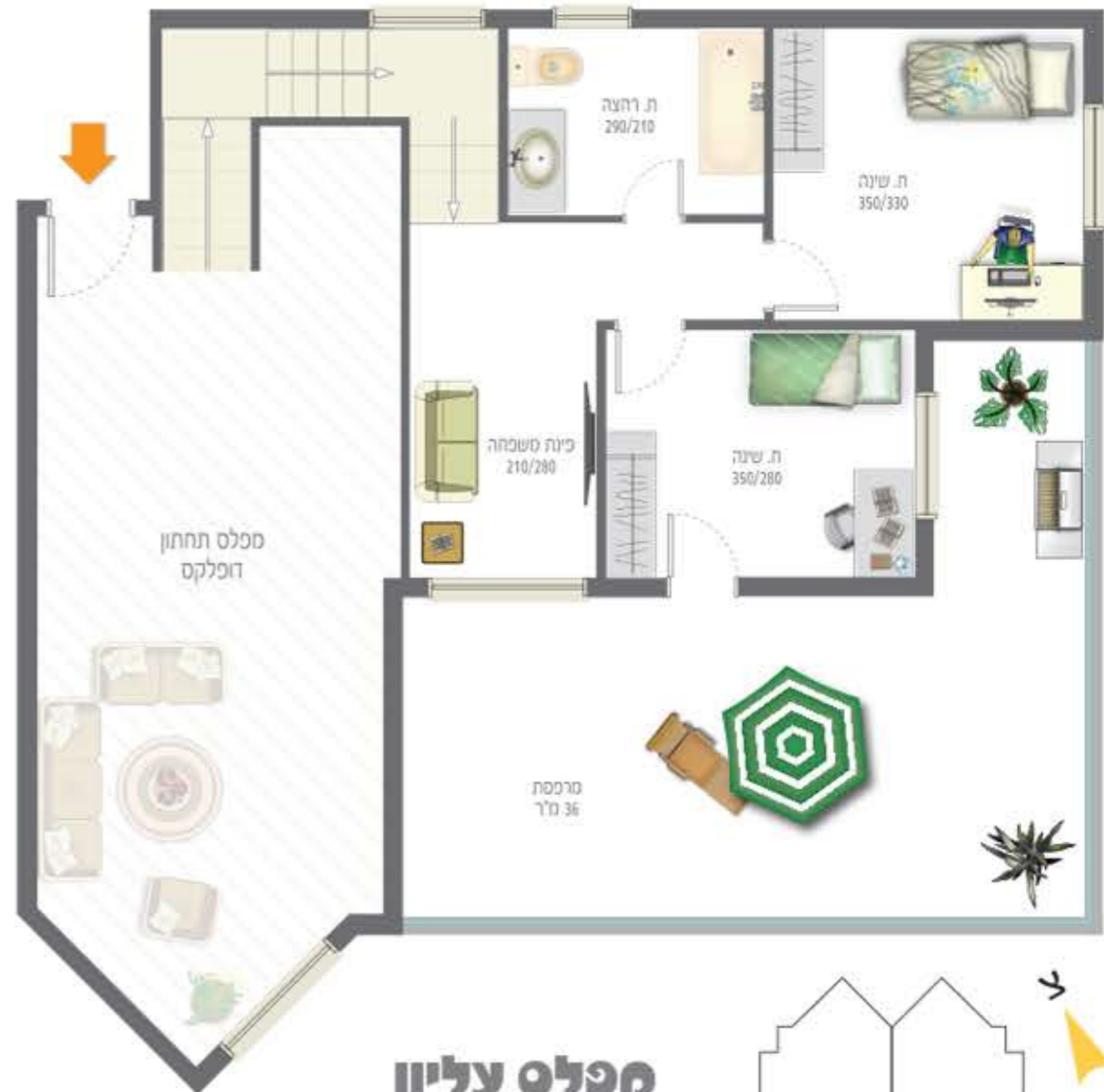
מכלס עליון קומה ה