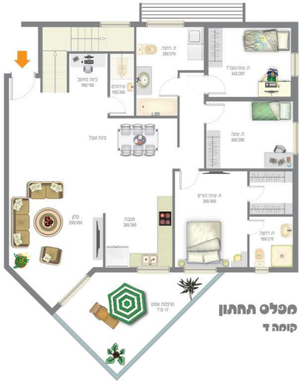
מכלס תחתון קומה ד